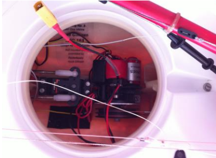
Liggande RMG bakom fenbox